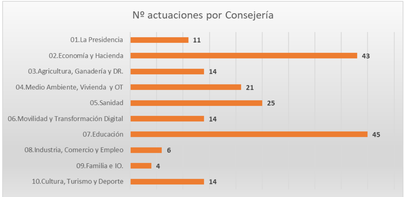
Gráfico 2. Actuaciones Plan de Trabajo RIS3, 2026. Centros Directivos