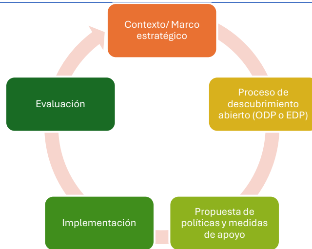
Gráfico 5. Ciclo de la Especialización Inteligente